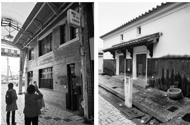
銀座商店街高砂通運旧本店と松宗蔵(共に登録有形文化財)

このセミナーの魅力は、開催しなければ訪れる機会がないかもしれない「まち」のこと、建築士の地道な取り組みを五感をフルに使って学べることだと思います。