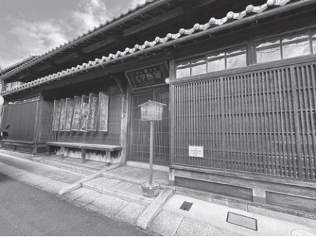
旧木之本宿本陣(竹内家住宅)外観

※お車の方は、JR木之本駅東口前の駐車場をご利用ください。 ※歩きやすい服装と靴でご参加ください。 ※荒天等により中止の場合は前日にご連絡します。