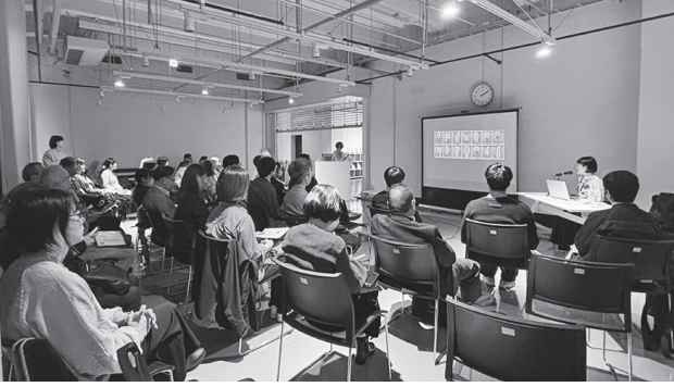
講演を熱心に聞き入る参加者