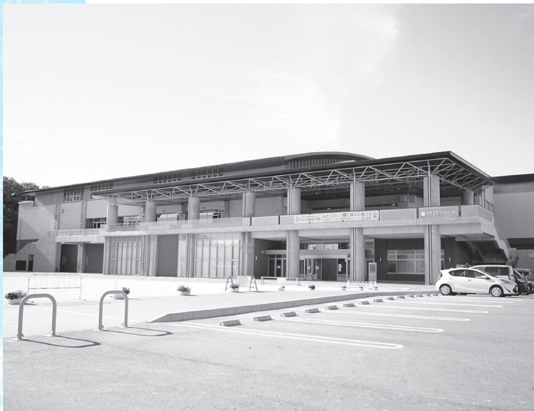
わたSHIGA輝く国スポ・障スポ2025 会場探訪／YMITアリーナ（くさつシティアリーナ）（草津市）

2019年6月に「新たな『にぎわい』と『ALLくさつ』のスポーツライフの創造」をコンセプトとし、「地域のスポーツ実施率を高める活動拠点」、「中心市街地活性化に貢献する集客拠点」、「コミュニティを醸成する交流拠点」、「地域の安全・安心環境を高める防災拠点」としてオープンした。