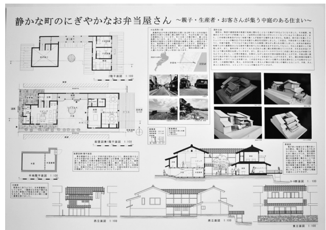
滋賀県立安曇川高等学校 「静かな町のにぎやかなお弁当屋さん ～親子・生産者が集う中庭のある住まい～」