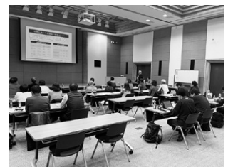
盛り沢山のテーマで講習