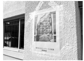
応急危険度ケーススタディ