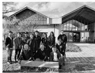
安曇野ちひろ美術館にて