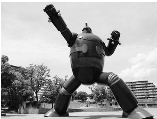
神戸・新長田のシンボル 鉄人28号

※滋賀県建築士会HP http://www.kentikushikai.jp/ 【参加申込】からもお申込み頂けます。