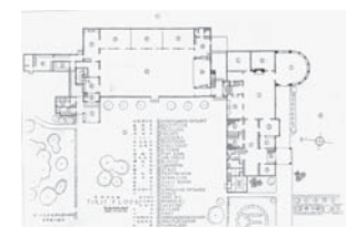
近江兄弟社ハイド記念館平面図