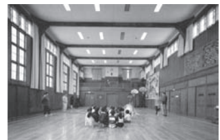
近江兄弟社ハイド記念館(教育会館)内部 (創元社「ヴォーリス建築の100年」より引用)

特筆するところとして、1階の廊下が意図的に遊戯室から教育会館へ通り抜けできるように計画している。これは、隣のクラスの人と出会い、挨拶し合えるように配慮されているのであろう。建物自身が、教育の器としての情操空間である。(石井和浩)