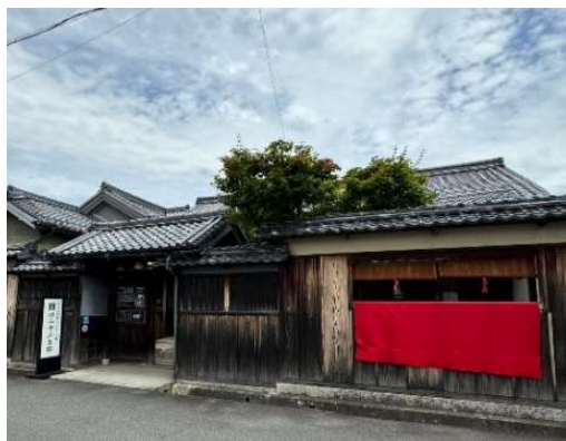
近江日野商人ふるさと館

滋賀県東近江市生まれ。 日野町教育委員会町史編さん室を経て、現在、日野町教育委員会生涯学習課主席参事・近江日野商人ふるさと館長。 文化財保護行政を担当するとともに、日野の歴史文化を活かしたまちづくりに携わっている。