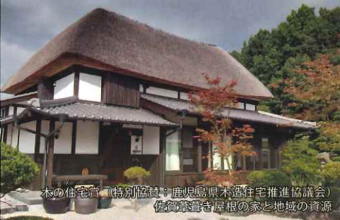
木の住宅賞 (特別協賛: 鹿児島県木造住宅推進協議会) 佐高寧斎き屋根の家と地域の資源