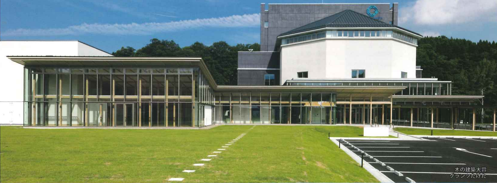
木の建築大賞 クラブツタけた