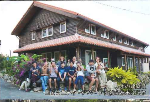
木の建築賞 コミュニティ・アパード 山城のおまほじや