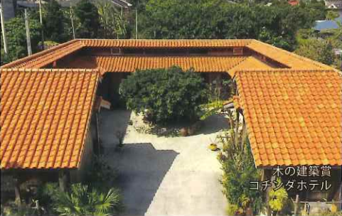
木の建築賞 コチンタホテル