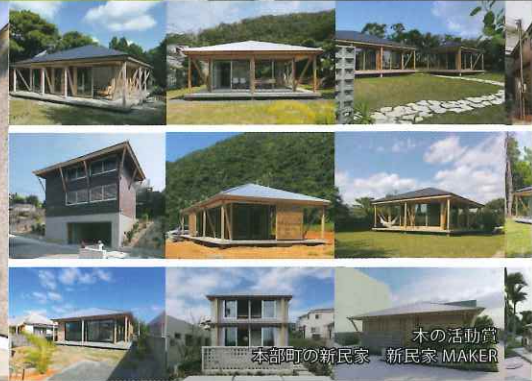
木の活動賞 本郷町の新民家、新民家MAKER