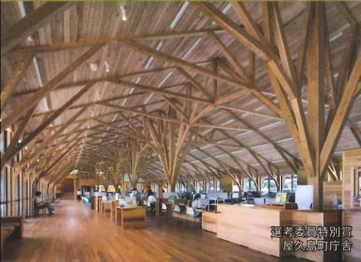
選考委員特別賞 屋久島町庁舎