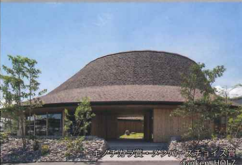
木のチカラ賞・メンバーズチョイス賞 damken. HOLZ