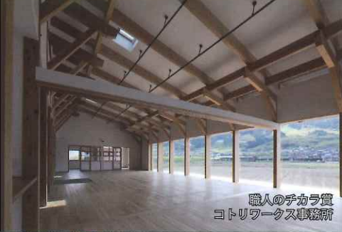
職人のチカラ賞 コトリワークス事務所