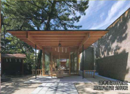
選考委員特別賞 鳥飼八幡宮 対拝殿