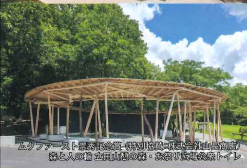
ムクファースト顕彰記念賞 (特別協賛: 株式会社山長商店) 森と人の輪 立田山越の森・お祭り広場公衆トイレ