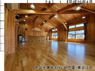
市立永源寺もみじ幼稚園(東近江市)

内閣官房HP CLT活用促進のための政府一元窓口 https://www.cas.go.jp/jp/seisaku/cltmadoguchi/index.html