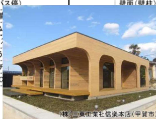
(株)三東工業社信楽本店(甲賀市)