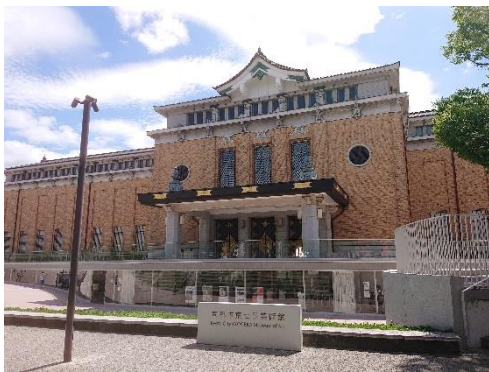
京都市京セラ美術館