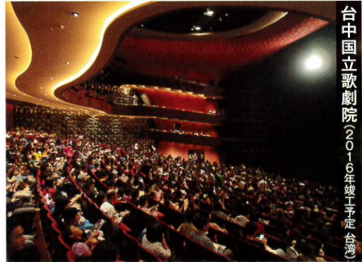
台中国立歌劇院(2016年竣工予定台湾)