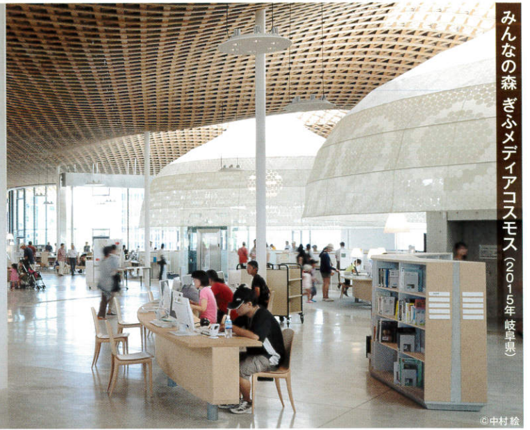
みんなの森 ぎふメディアコスモス(2015年岐阜県)